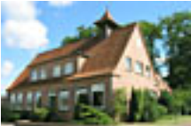
Wien Hilf Jeersdorf